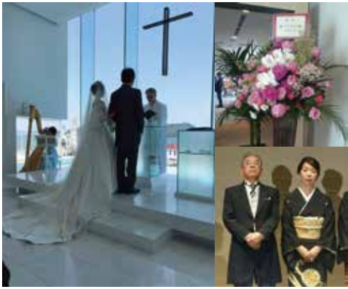
▲挙式・披露宴の様子

社員一同も各自担当現場のスタッフさんのご協力のもと出席することができました。ご協力ありがとうございました。