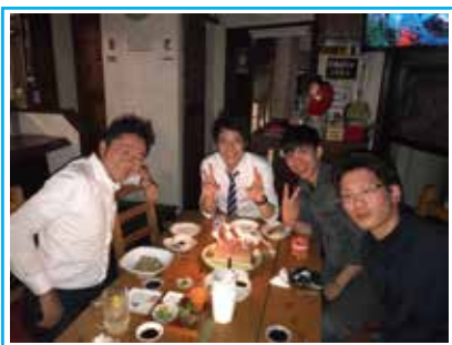
先日の歓迎会の様子

入社してからまだ間もないですが、早く会社に貢献できるように一杯頑張りますので、よろしくお願ひします。